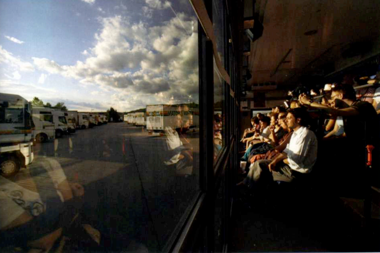
En 2006, à bord du Cargo Sofia-Ljubljana, les spectateurs-passagers sont embarqués dans le "théâtre de route" de Stefan Kaegi.

laboratoire dont il explore « le potentiel plastique et culturel » – en déplaçant une série d'objets urbains emblématiques, en créant des panneaux d'affichage atypiques... Également à l'écoute de la ville et de ses métamorphoses, le collectif d'architectes et d'artistes Pixel 6 a conçu le Bulb : une demi-sphère posée sur une place publique où sont projetés images et sons captés et remixés pendant deux semaines d'immersion dans un quartier ou un village.